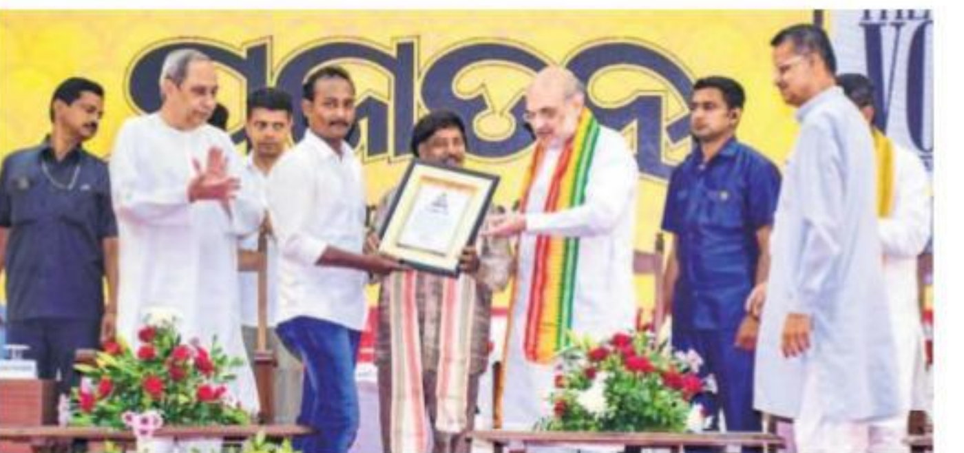
Union Home Minister Amit Shah with Odisha Chief Minister Naveen Patnaik and others during an event for celebration of the 75th anniversary of the newspaper 'Prajatantra', in Cuttack, on Monday

"Now Shinde is unable to fulfil his promise, hence the delay in cabinet expansion. The chief minister should disclose reasons for the delay," Pawar said. Pawar also said there has been no invitation to him so far from the govt for Tuesday's ministry expansion. It is clear that not all of the 40 rebel Sena MLAs who are in the Shinde group will get the ministerial berth, he added.