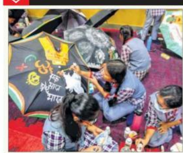
School students participate in an umbrella painting workshop, organised under 'Azadi Ka Amrit Mahotsav' celebrations, in Varanasi, on Monday